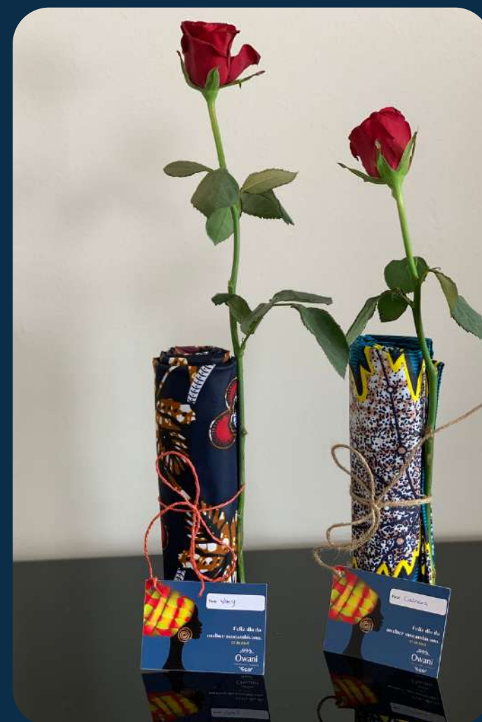
Capulana e rosa