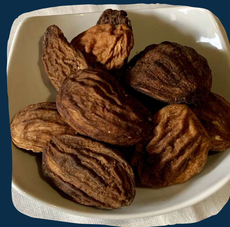
Atxeto (manga seca)