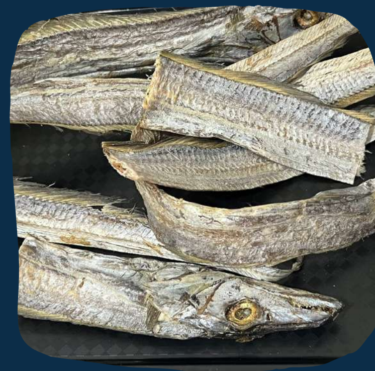
Peixe cintura seco