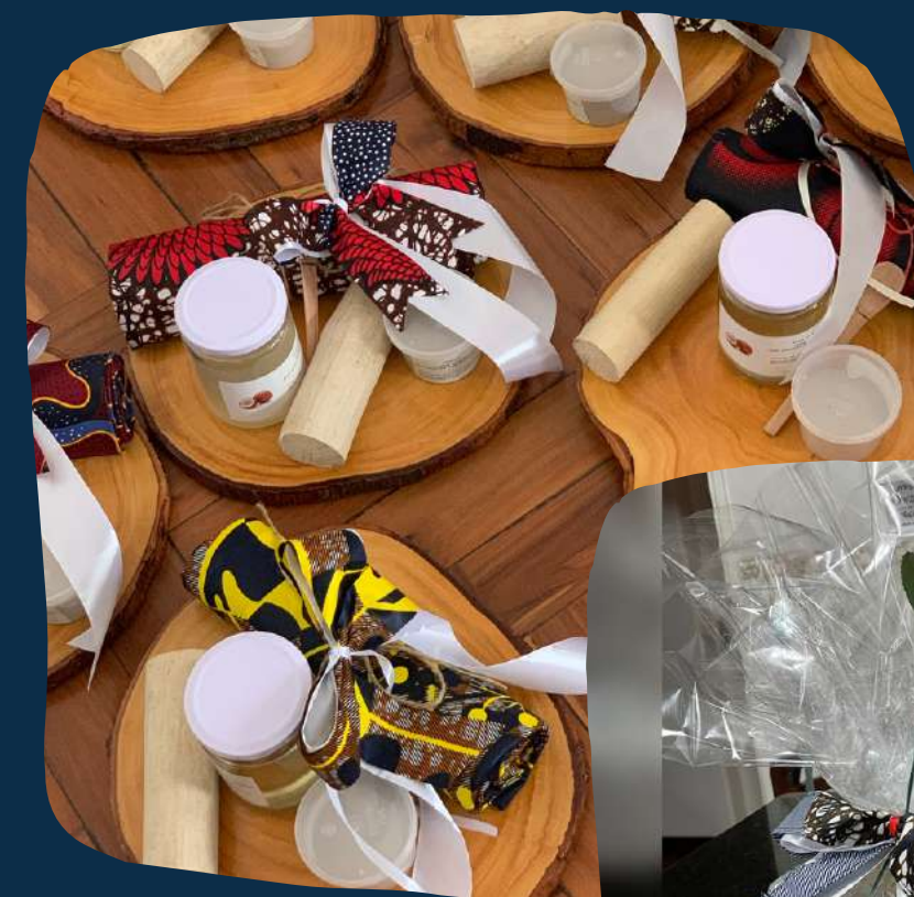
Kit mulher moçambicana

Capulana, mussiro, argila, óleo de coco, colher de pau e rosa em base de madeira