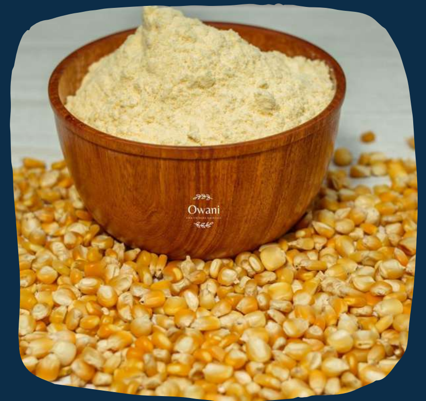
Farinha de milho amarelo