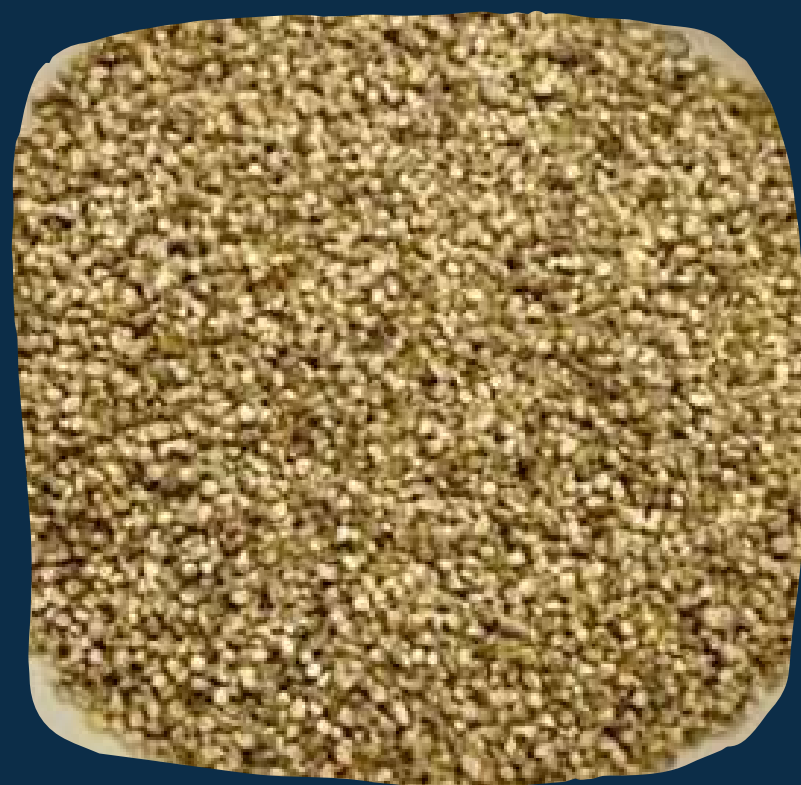
Grãos de mexoeira