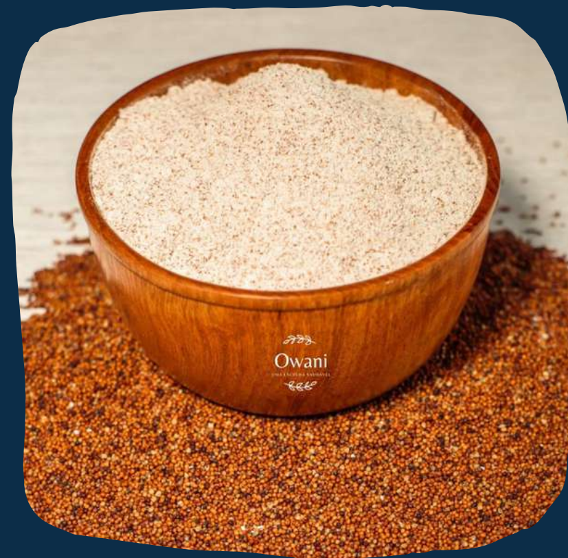
Farinha de marrupi