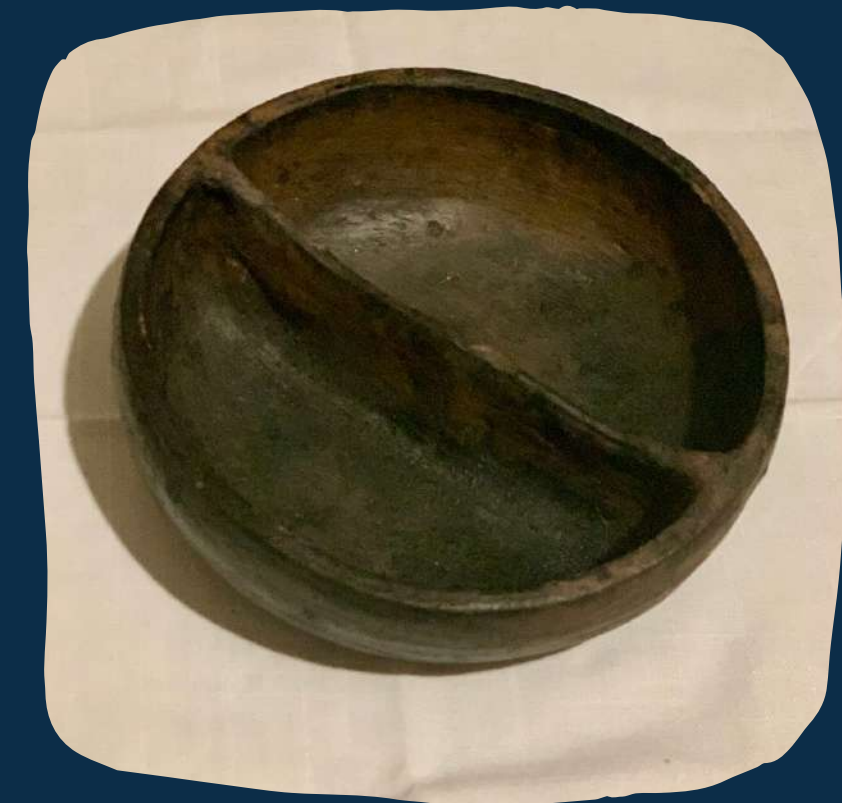
Forma de barro