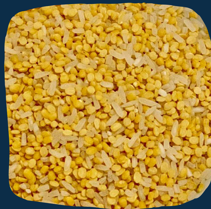
Mix da terra 3 (mistura para mucapata)