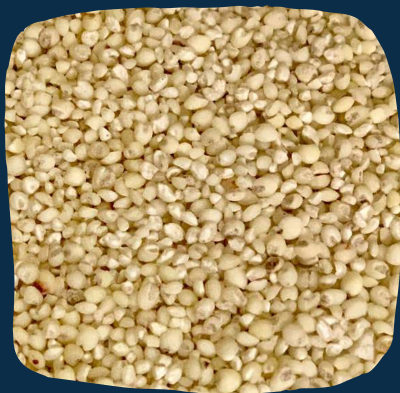
Grãos de mapira