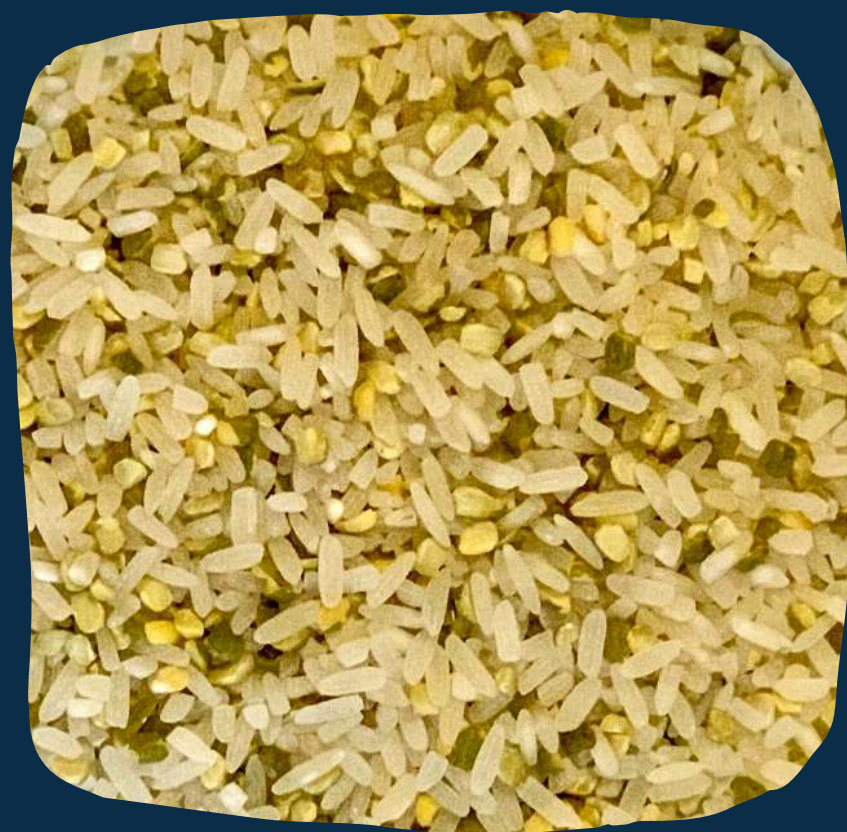
Mix da terra 1 (arroz holoco)