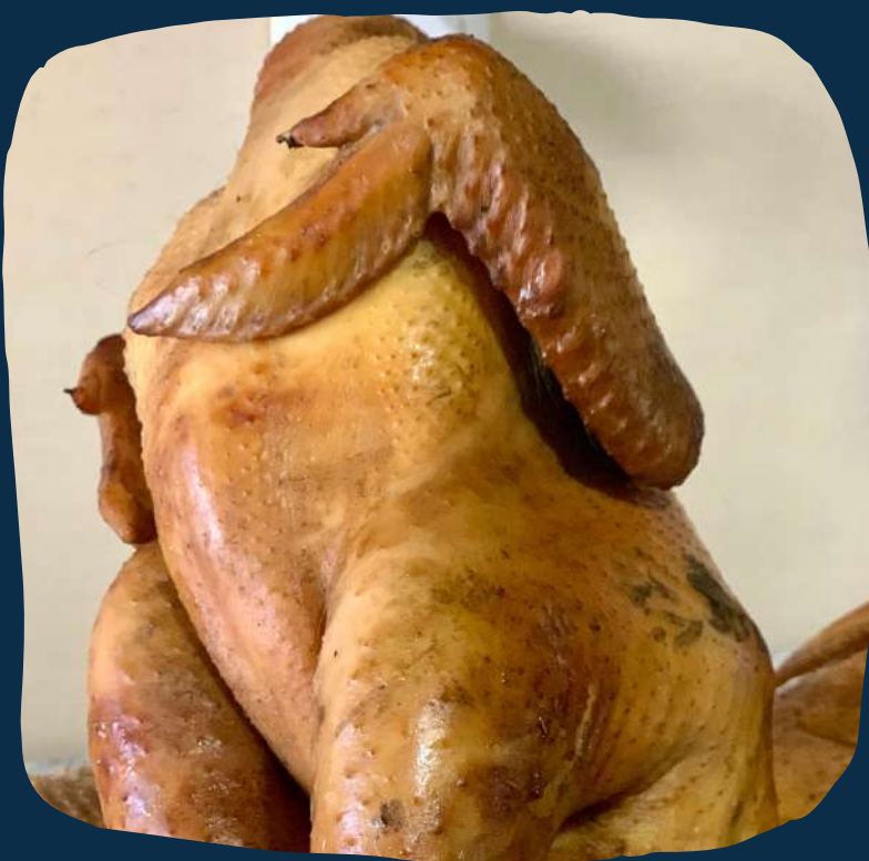
Galinha cafireal defumada