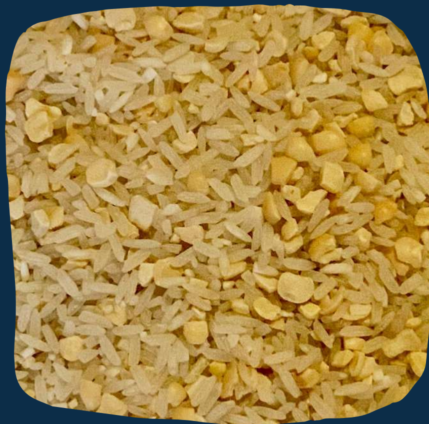
Mix da terra 2 (arroz cute)