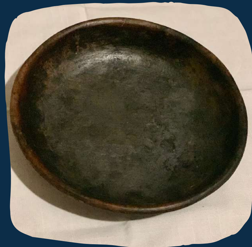
Forma de barro