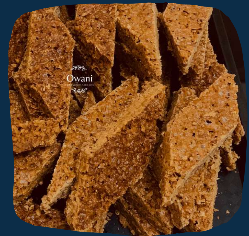
Doce de coco