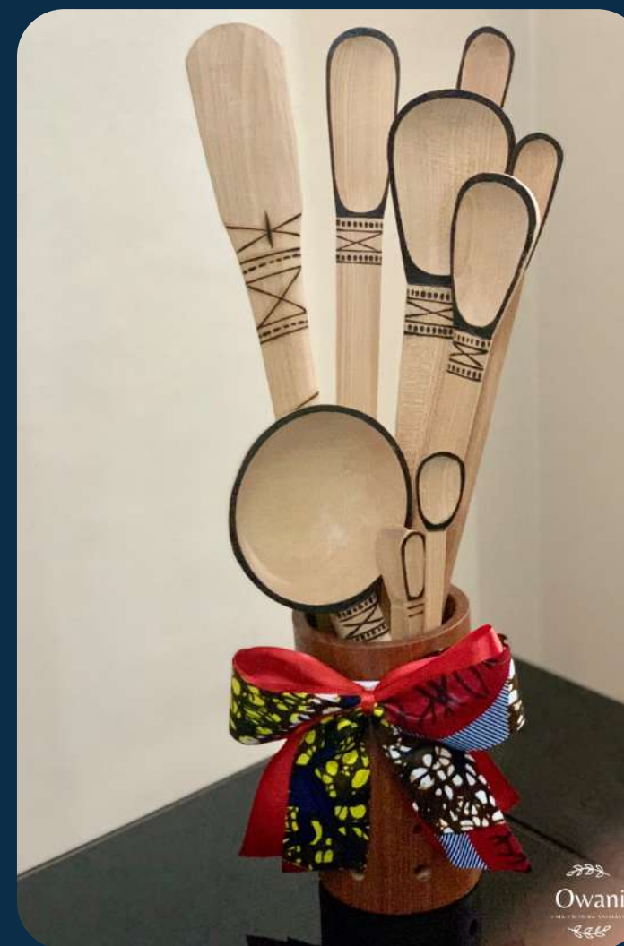
Jogo de colheres de pau