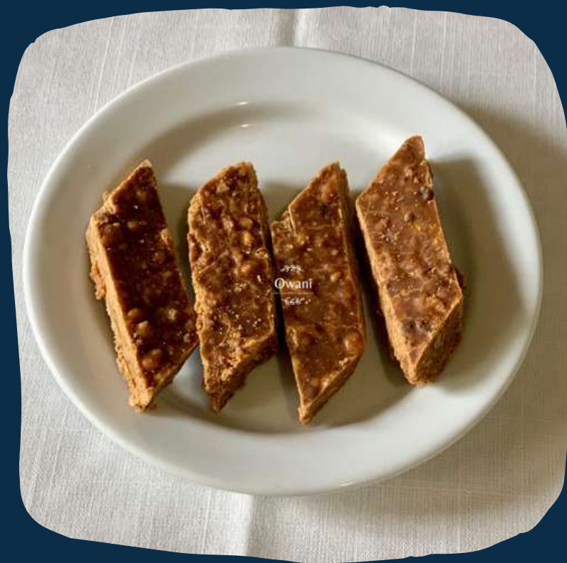
Doce de amendoim granulado