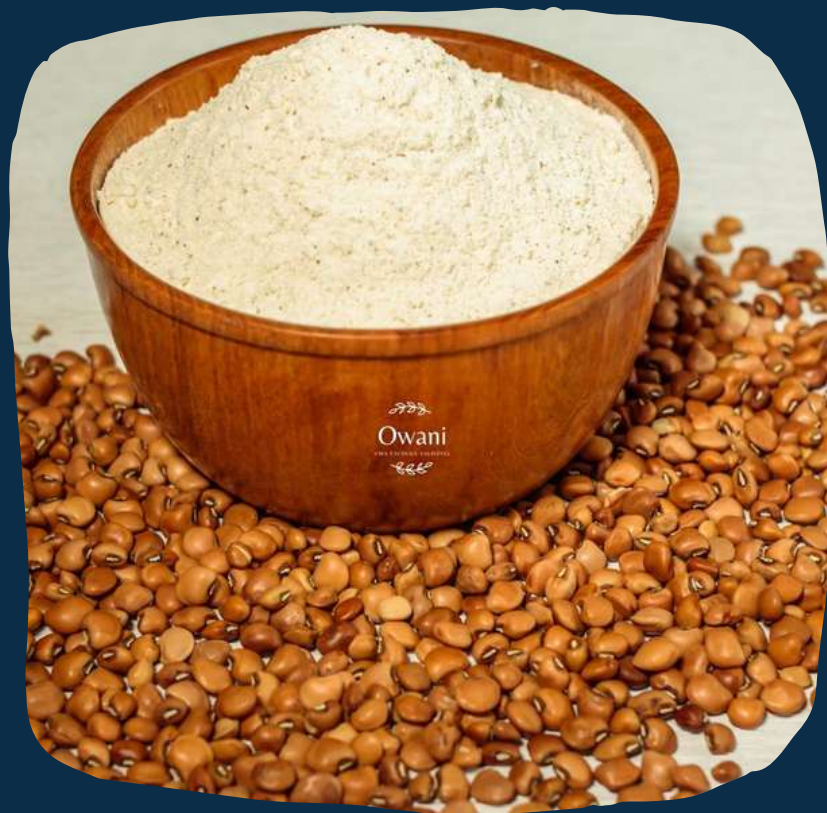
Farinha de feijão nhemba