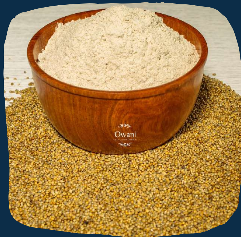
Farinha de mexoeira