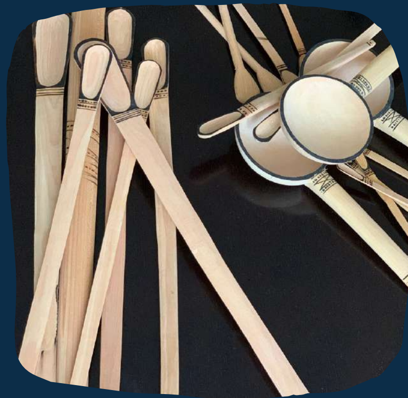
Colheres de pau