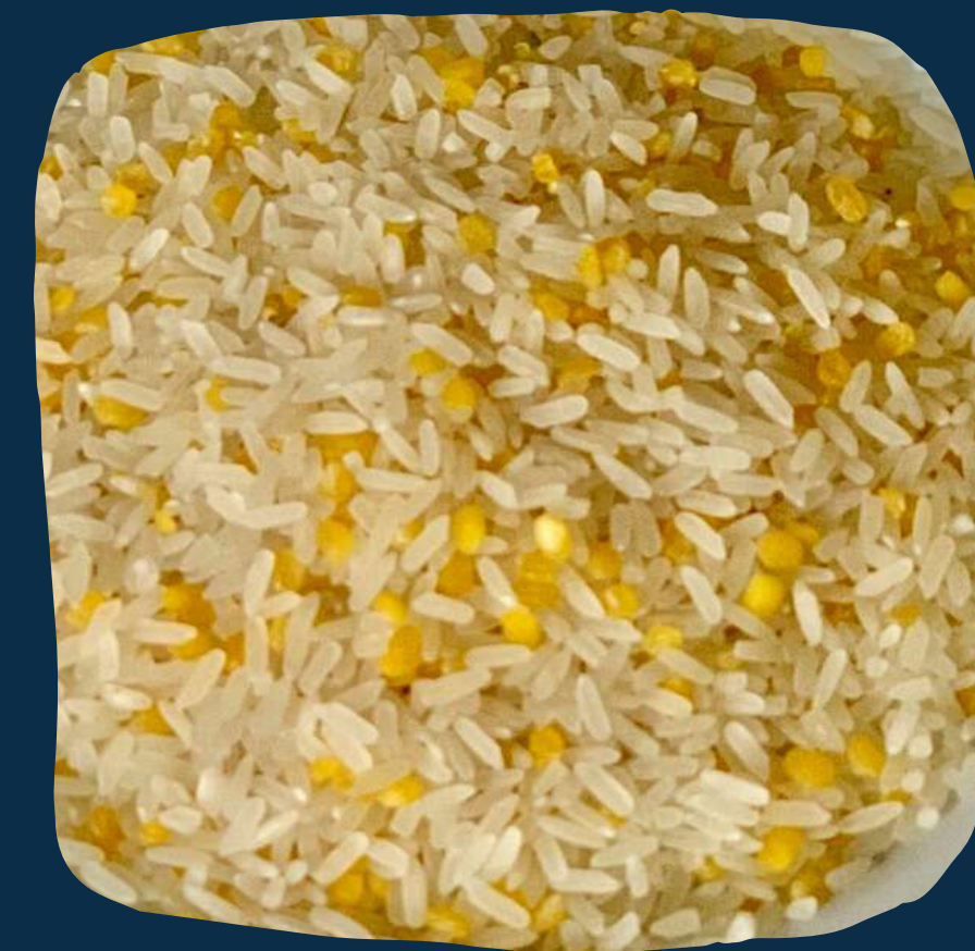
Mix da terra 4 (arroz holoco sem cascas)