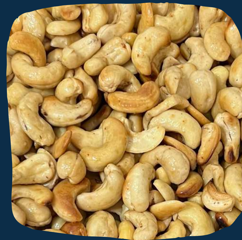
Castanhas de caju picantes